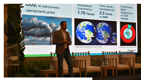
Sustainable Construction Summit