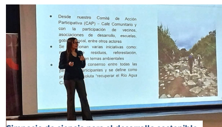
Simposio de ciencia para el desarrollo sostenible