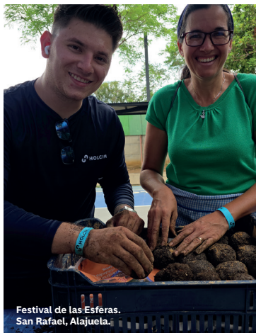
Festival de las Esferas. San Rafael, Alajuela.

"Existe una conexión entre nosotros, la naturaleza, la tierra y la sociedad, y entre todos podemos lograr un mejor futuro para las presentes y próximas generaciones. Involúcrense y aprendan. El valor principal es la gratificación personal con la vida."