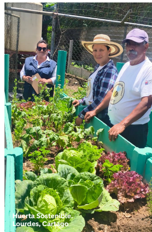
Huerta Sostenible. Lourdes, Cartago