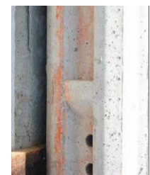
Detalle de ménsula